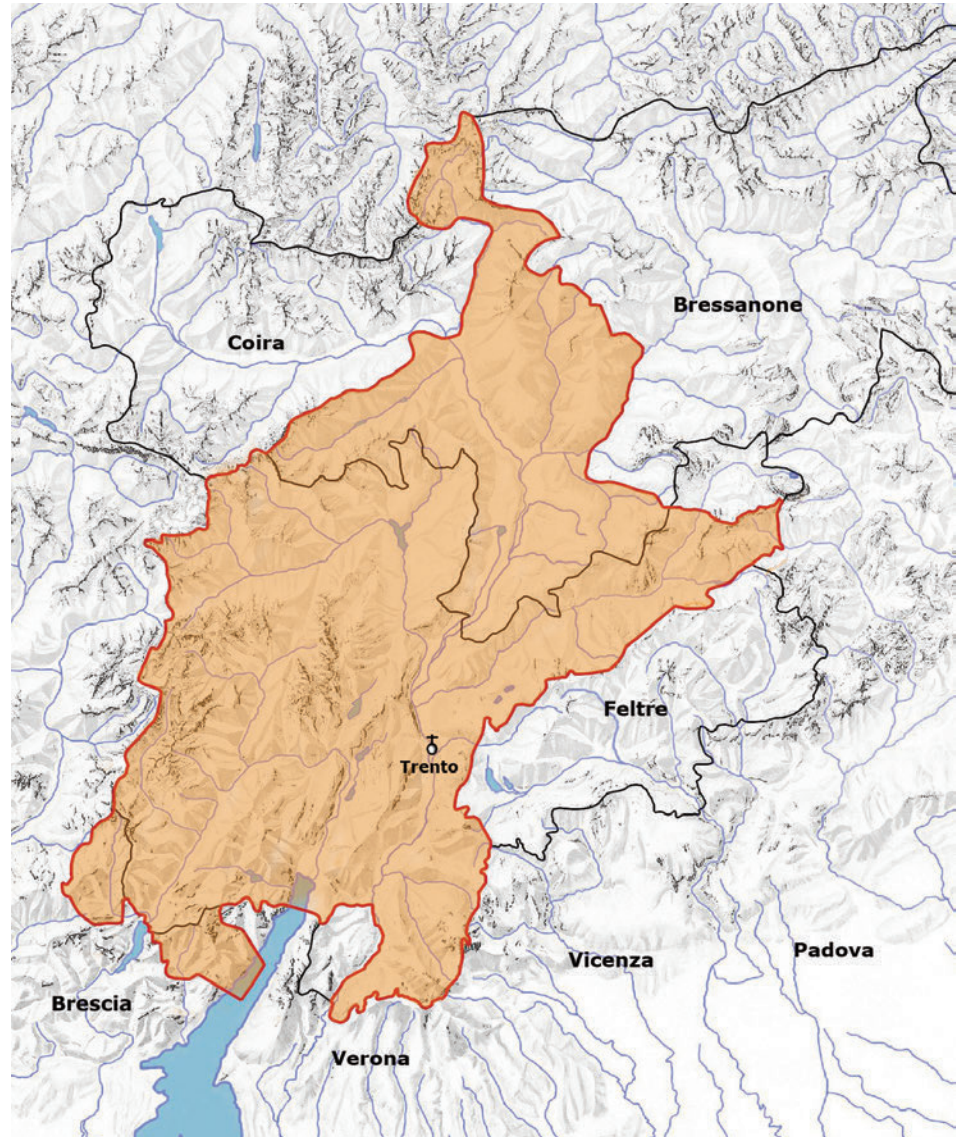
Fig. 1. Limiti della diocesi di Trento dal IX al XVIII secolo.

stando a Levico in Valsugana, il pievano di Calceranica si rivolse con tono deciso al vicario del vescovo di Feltre per chiedere che i rettori delle chiese di San Vittore di Levico e di San Giorgio di Vigolo Vattaro, cappelle soggette alla pieve, cessassero di battezzare i bambini, di seppellire i morti e di amministrare i sacramenti senza la sua autorizzazione, quod est contra debitum ius, cum talia fieri debent in plebe solummodo et non in capellis . Le controparti dichiararono che questi comportamenti erano sempre stati considerati leciti ( sine contradictione alicuius plebani qui unquam fuerit in dicta plebe ), ma non si permisero di contestare il principio che era stato affermato (Curzel 2005b, p. 116).