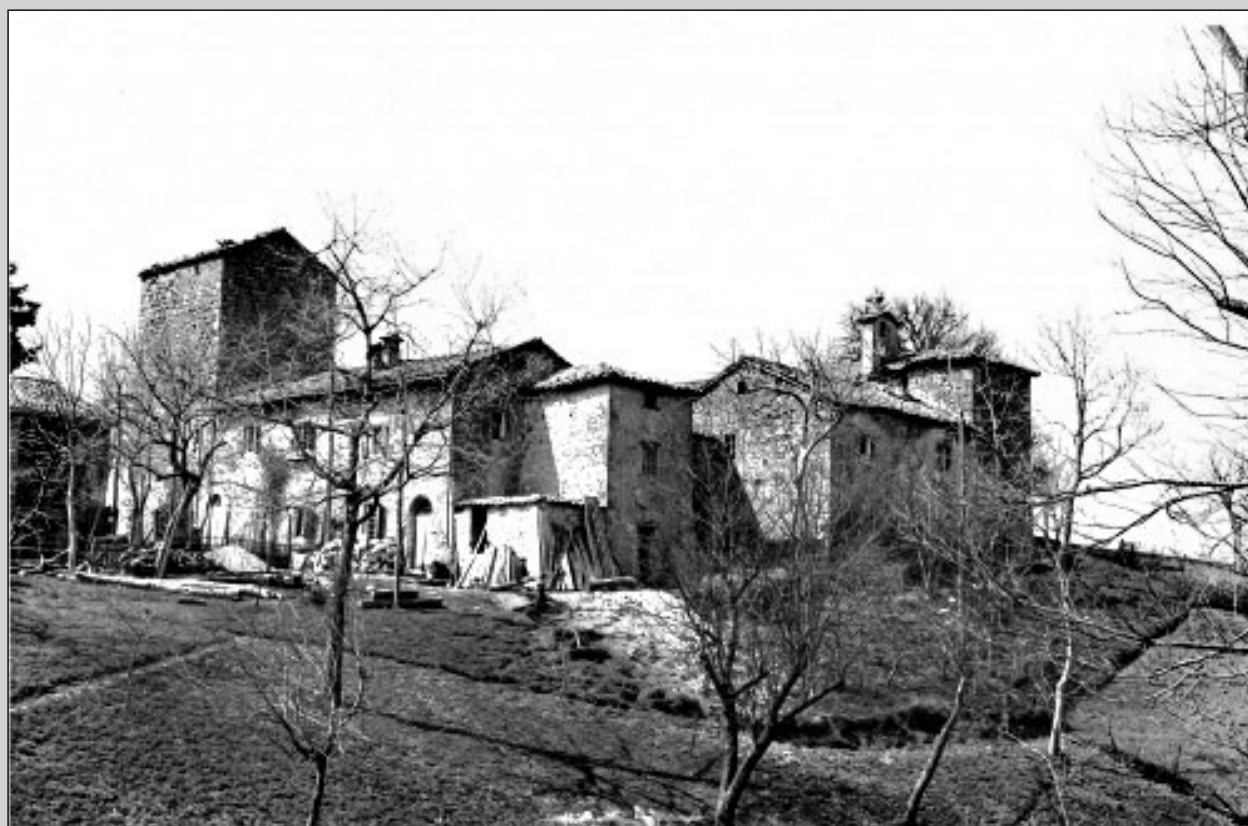
Fig. 4. Complesso di Santa Lucia di Roffeno (FANTINI L., Antichi edifici della montagna bolognese , Bologna 1971, vol. II, p. 362).