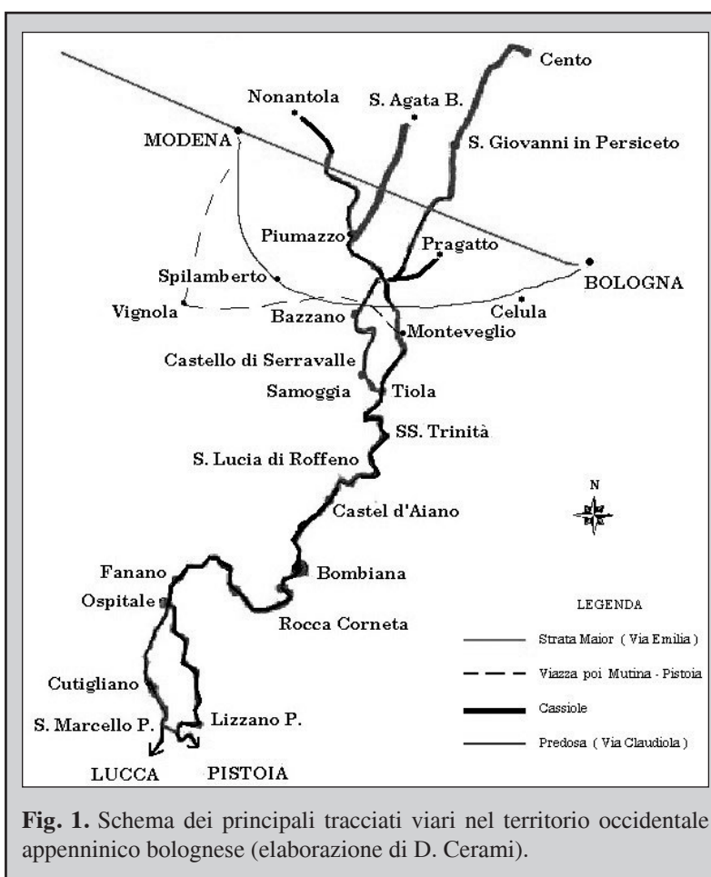
Fig. 1. Schema dei principali tracciati viari nel territorio occidentale appenninico bolognese (elaborazione di D. Cerami).

Questa assenza ha imposto di indagare il tema da un'altra angolazione, cioè quella del corpus documentario